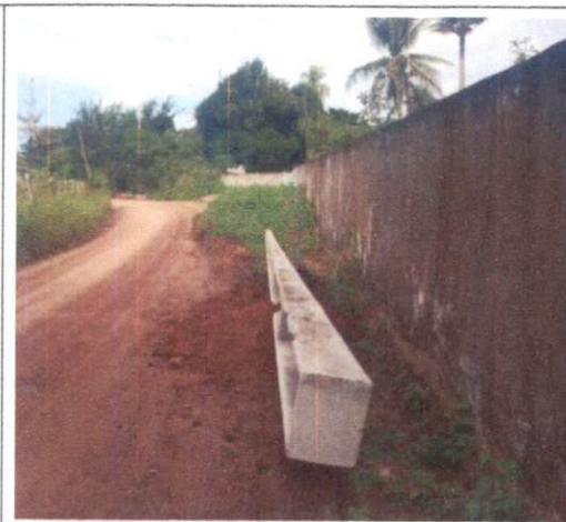
Foto 2: Escavação para instalação de poste e poste de concreto. Comprova os itens 3.1 e 3.2.