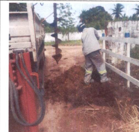
Foto 6: Escavação e instalação de poste e poste de concreto. Comprova os itens 3.1 e 3.2.