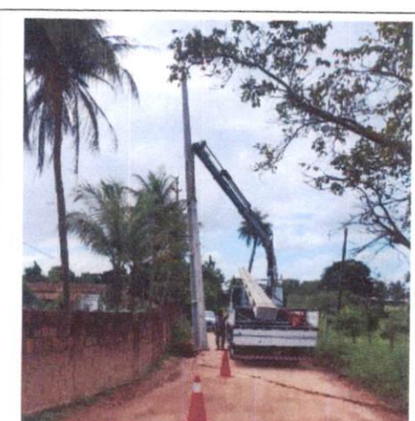
Foto 4: Escavação e instalação de poste e poste de concreto. Comprova os itens 3.1 e 3.2.