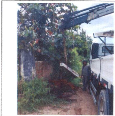
Foto 1: Escavação para instalação de poste e poste de concreto. Comprova os itens 3.1 e 3.2.