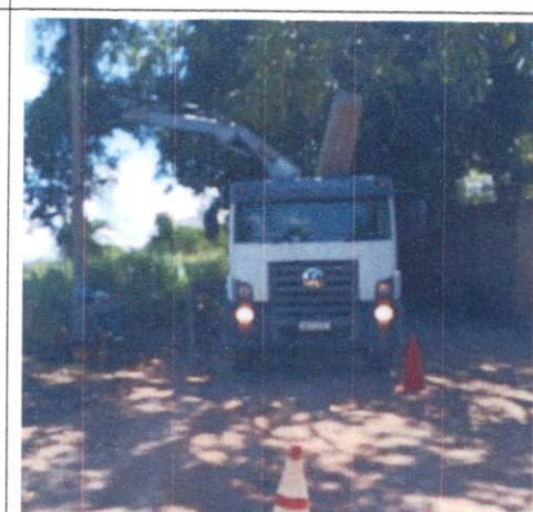
Foto 8: Escavação e instalação de poste e poste de concreto. Comprova os itens 3.1 e 3.2.

ALLAN EMMANUEL FERREIRA DA ROCHA 0099325349