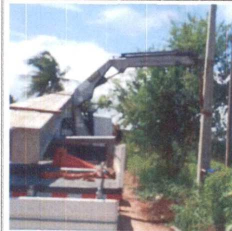
Foto 5: Escavação e instalação de poste e poste de concreto. Comprova os itens 3.1 e 3.2.