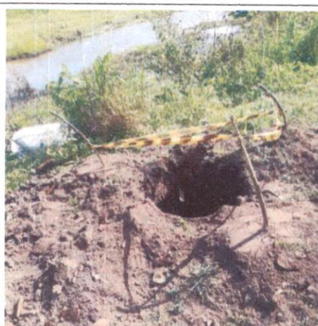
Foto 7: Escavação e sinalização de advertência para instalação de poste e poste de concreto. Comprova o item 3.2.