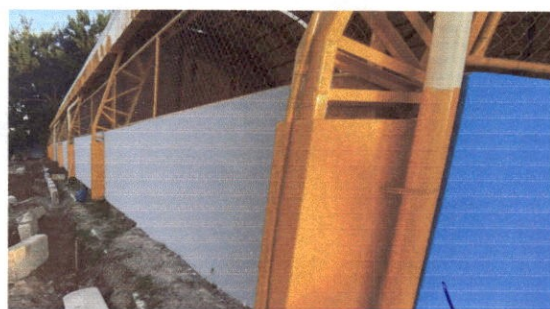
11.9 Pintura texturizada acrílica (grafiato)