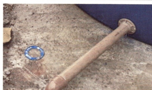
12.1.7 Adaptador PVC soldável longo Ø60mm x 2" com flange para caixa d'água, fornecimento e instalação"

OCTAGON EMPREENDIMENTOS LTDA Ayslla Jany de Moraes Silva Eng. Civil CREA n° 181726131-2