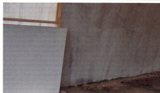
11.8 Fundo selador acrílico para grafiato