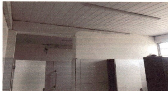
11.6 Emassamento com lixamento de parede para pintura PVA