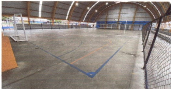
11.5 Pintura acrílica de faixas de demarcação em quadra poliesportiva

OBJETO: CONTRATAÇÃO DE EMPRESA DE ENGENHARIA PARA CONCLUSÃO DE CONSTRUÇÃO DE CONSTRUÇÃO DE QUADRA COBERTA COM VESTIÁRIO DO COLÉGIO MUNICIPAL DE GUADALAJARA, NO MUNICÍPIO DE PAUDALHO-PE.