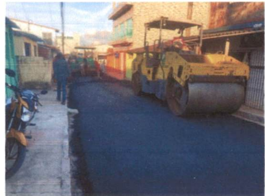
Item: 15.1.2- EXECUÇÃO DE PAVIMENTO COM APLICAÇÃO DE CONCRETO ASFÁLTICO, CAMADA DE ROLAMENTO - EXCLUSIVE CARGA E TRANSPORTE – RR-2C – RUA 01- GUADALAJARA