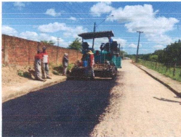
Item: 2.3.2 -EXECUÇÃO DE PAVIMENTO COM APLICAÇÃO DE CONCRETO ASFÁLTICO, CAMADA DE BINDER - EXCLUSIVE CARGA E TRANSPORTE. AF_11/2019