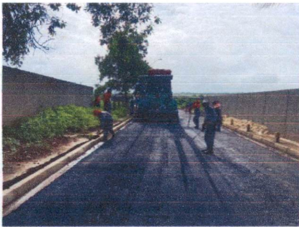
Item: 2.3.2 -EXECUÇÃO DE PAVIMENTO COM APLICAÇÃO DE CONCRETO ASFÁLTICO, CAMADA DE BINDER - EXCLUSIVE CARGA E TRANSPORTE. AF_11/2019