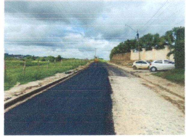
Item: 2.3.2 -EXECUÇÃO DE PAVIMENTO COM APLICAÇÃO DE CONCRETO ASFÁLTICO, CAMADA DE BINDER - EXCLUSIVE CARGA E TRANSPORTE. AF_11/2019