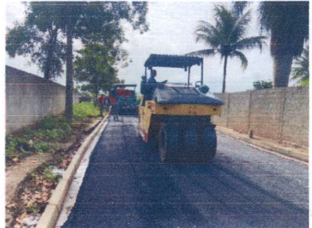
Item: 2.3.2 -EXECUÇÃO DE PAVIMENTO COM APLICAÇÃO DE CONCRETO ASFÁLTICO, CAMADA DE BINDER - EXCLUSIVE CARGA E TRANSPORTE. AF_11/2019