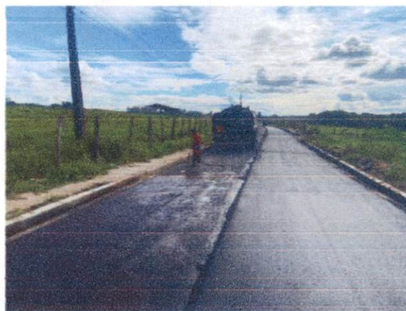
Item: 2.1.1 - EXECUÇÃO DE PINTURA DE LIGAÇÃO COM EMULSÃO ASFÁLTICA RR-2C. AF_11/2019