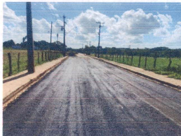
Item: 2.3.3 EXECUÇÃO DE PAVIMENTO COM APLICAÇÃO DE CONCRETO ASFÁLTICO, CAMADA DE ROLAMENTO - EXCLUSIVE CARGA E TRANSPORTE. AF_11/2019