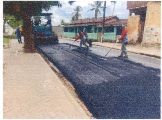
Item: 2.3.3 EXECUÇÃO DE PAVIMENTO COM APLICAÇÃO DE CONCRETO ASFÁLTICO, CAMADA DE ROLAMENTO - EXCLUSIVE CARGA E TRANSPORTE. AF_11/2019