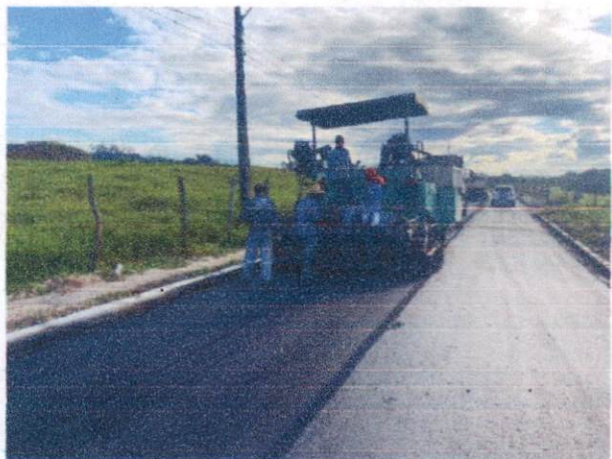
Item: 2.3.3 EXECUÇÃO DE PAVIMENTO COM APLICAÇÃO DE CONCRETO ASFÁLTICO, CAMADA DE ROLAMENTO - EXCLUSIVE CARGA E TRANSPORTE. AF_11/2019