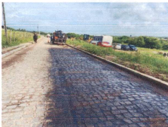
Item: 2.1.1 - EXECUÇÃO DE PINTURA DE LIGAÇÃO COM EMULSÃO ASFÁLTICA RR-2C. AF_11/2019