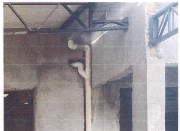
Foto 40: Junção simples de 100mm para instalação sanitária (Item 14.11)

OCTAGON EMPREENDIMENTOS LTDA Ayslla Jéssica de Moraes Silva Eng. Civil - CREA nº 181726131-2