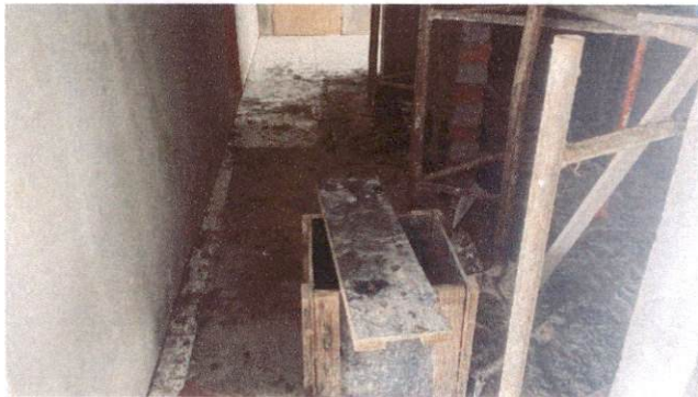
Foto 11: Aplicação de cerâmica na circulação próximo à sala de telefonia do Bloco A (Item 10.1.6)