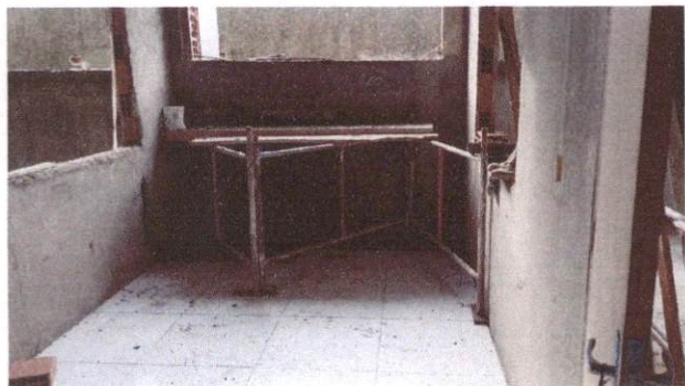
Foto 17: Aplicação de cerâmica na amamentação do Bloco A (Item 10.1.6)