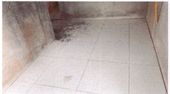
Foto 12: Aplicação de cerâmica na circulação próximo à sala de telefonia do Bloco A (Item 10.1.6)

OCTAGON EMPREENDIMENTOS LTDA Ayslla Jaqueline de Moraes Silva Eng. Civil CREA nº 181726131-2