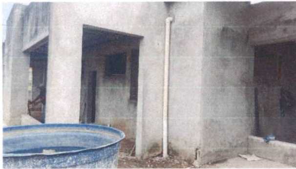
Foto 29: TUDO de PVC 100mm para drenagem de águas pluviais Bloco A (Item 13.1.1)