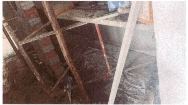
Foto 10: Aplicação de cerâmica na sala de telefonia do Bloco A (Item 10.1.6)