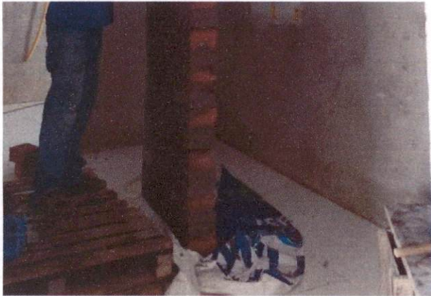
Foto 9: Aplicação de cerâmica na sala de telefonia do Bloco A (Item 10.1.6)