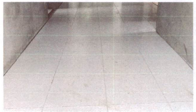
Foto 28: Aplicação de cerâmica na circulação do Bloco B (Item 10.1.6)

OCTAGON EMPREENDIMENTOS LTDA Ayslla Jayne de Moraes Silva Eng. Civil CREA 1726131-2