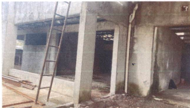
Foto 31: TUDO de PVC 100mm para drenagem de águas pluviais Bloco B (Item 13.1.1)