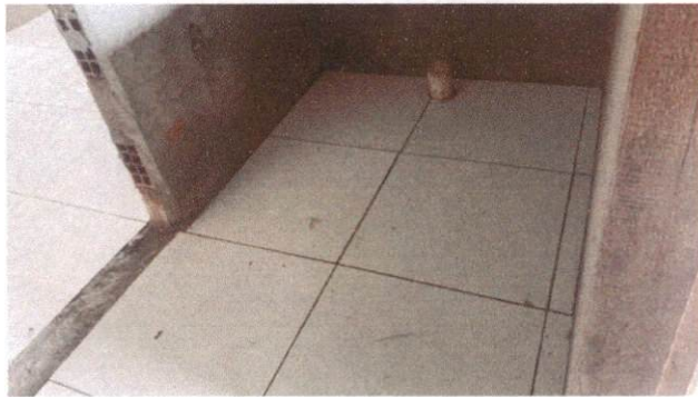
Foto 15: Aplicação de cerâmica na higienização do Bloco A (Item 10.1.6)