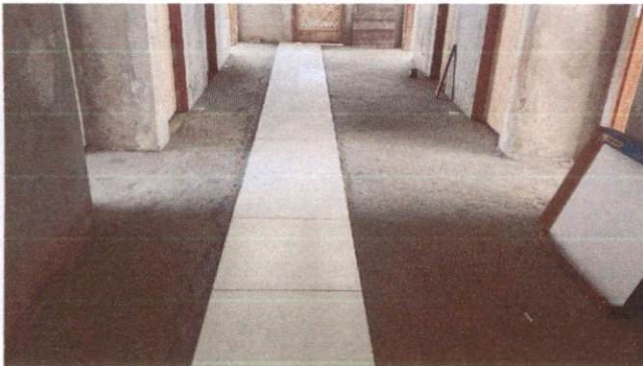
Foto 27: Aplicação de cerâmica na circulação do Bloco B (Item 10.1.6)