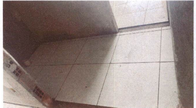
Foto 16: Aplicação de cerâmica na higienização do Bloco A (Item 10.1.6)

OCTAGON EMPREENDIMENTOS LTDA Ayslla Janyne de Moraes Silva Eng. Civil - Matr.: 12.716.31-2