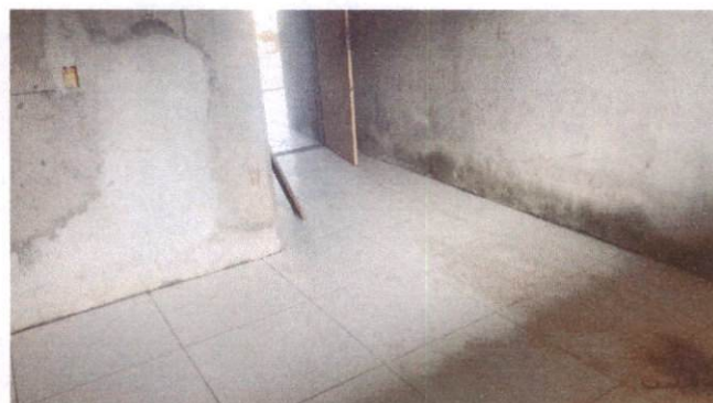
Foto 22: Aplicação de cerâmica na direção do Bloco A (Item 10.1.6)