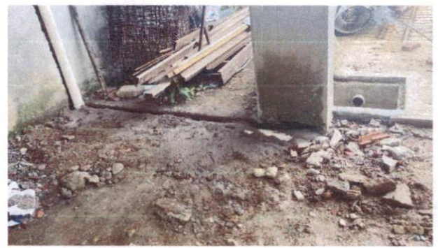
Foto 34: Tudo de PVC 100mm para drenagem de águas pluviais Lado interno AB (Item 13.1.1)