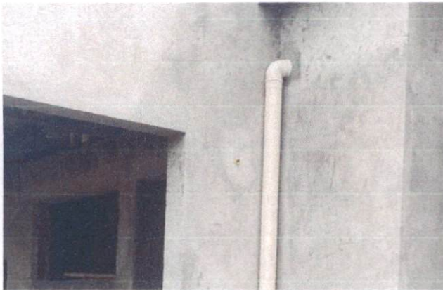
Foto 37: Joelho de 90º de 100mm para quedas do Bloco B (Item 13.1.4)