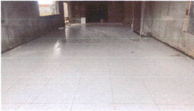
Foto 25: Aplicação de cerâmica no refeitório do Bloco A (Item 10.1.6)