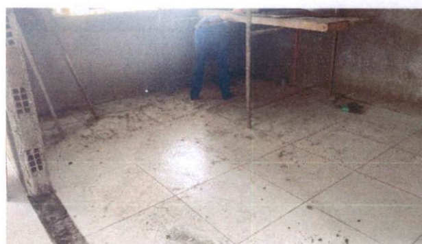
Foto 24: Aplicação de cerâmica na sala dos professores/reunião do Bloco A (Item 10.1.6)

OCTAGON EMPREENDIMENTOS LTDA Aysila Jayne de Moraes Silva Eng. Civil CREA: 181726131-2