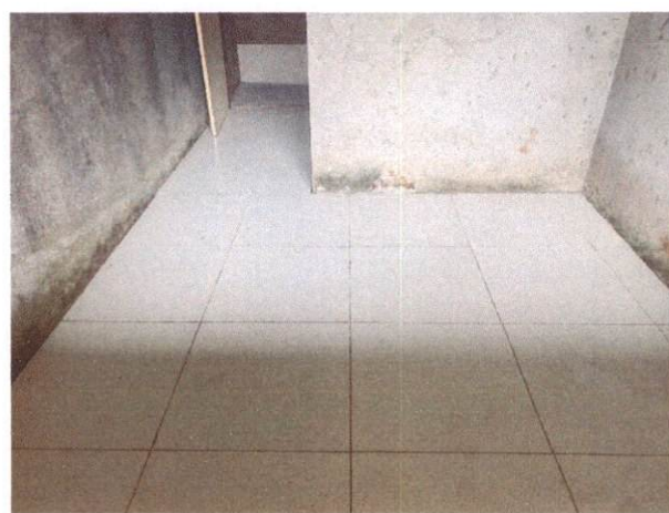
Foto 20: Aplicação de cerâmica no almoxarifado do Bloco A (Item 10.1.6)

OCTAGON EMPREENDIMENTOS LTDA Ayslla Jaqueline Moraes Silva Eng. Civil CREA nº 181726131-2