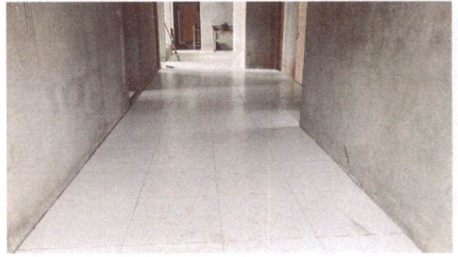
Foto 14: Aplicação de cerâmica na circulação maior do Bloco A (Item 10.1.6)