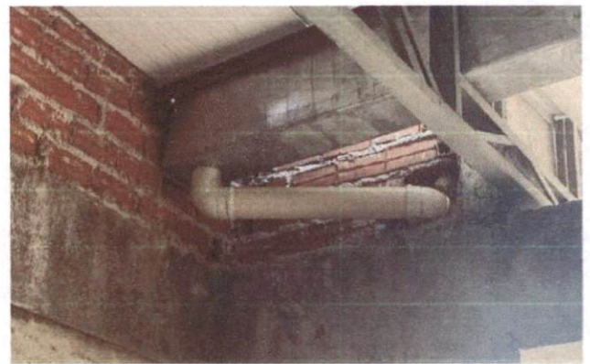
Foto 38: Joelho de 90º de 100mm para quedas do Bloco B (Item 13.1.4)