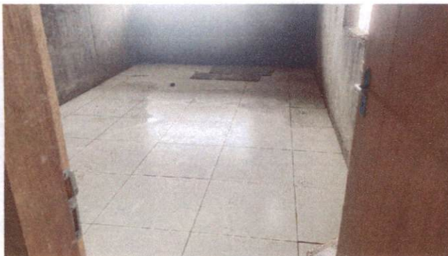
Foto 7: Aplicação de cerâmica na secretaria do Bloco A (Item 10.1.6)