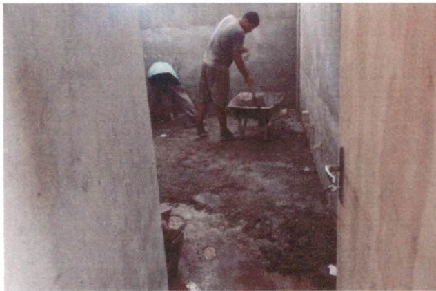
Foto 3: Contrapiso de concreto medido no aditivo - Bloco A (Item 10.1.1)