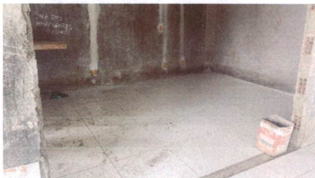
Foto 23: Aplicação de cerâmica na sala dos professores/reunião do Bloco A (Item 10.1.6)