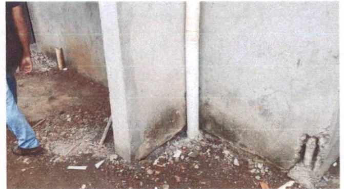
Foto 30: TUDO de PVC 100mm para drenagem de águas pluviais Bloco A (Item 13.1.1)