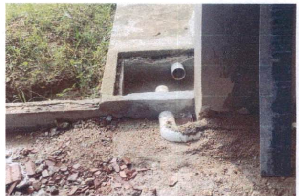
Foto 36: Joelho de 90° de 100mm para quedas do Bloco A (Item 13.1.4)

OCTAGON EMPREENDIMENTOS LTDA Ayslla Jayne de Moraes Silva Eng. Civil CREA nº 181726131-2