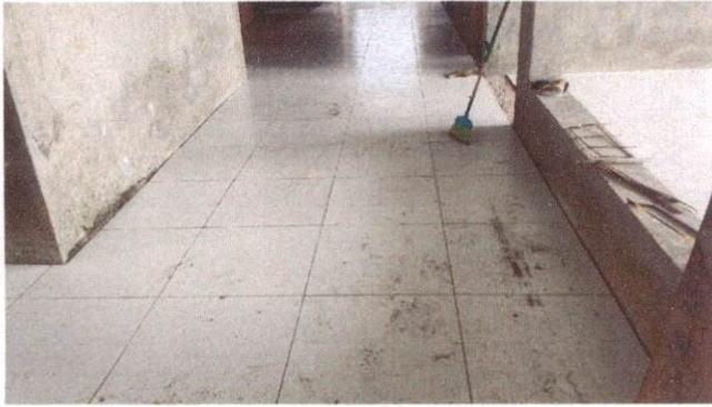
Foto 13: Aplicação de cerâmica na circulação maior do Bloco A (Item 10.1.6)