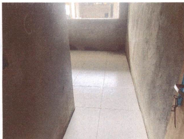
Foto 19: Aplicação de cerâmica no almoxarifado do Bloco A (Item 10.1.6)