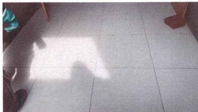
Foto 18: Aplicação de cerâmica na amamentação do Bloco A (Item 10.1.6)