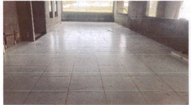
Foto 26: Aplicação de cerâmica no refeitório do Bloco A (Item 10.1.6)