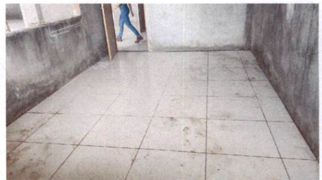
Foto 8: Aplicação de cerâmica na secretaria do Bloco A (Item 10.1.6)