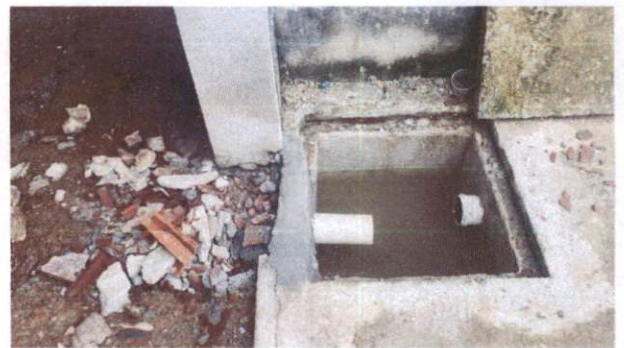
Foto 32: TUDO de PVC 100mm para drenagem de águas pluviais Bloco B (Item 13.1.1)

OCTAGON EMPREENDIMENTOS LTDA Ayslla Jayne de Moraes Silva Eng. Civil CREA nº 181726131-2