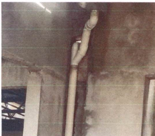
Foto 35: Joelho de 90° de 100mm para quedas do Bloco A (Item 13.1.4)