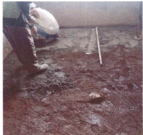
Foto 4: Camada regularizadora de piso medido no aditivo - Bloco A (Item 10.1.2)

OCTAGON EMPREENDIMENTOS LTDA Aysila Jayne de Moraes Silva Eng. Civil - CREA nº 181726131-2