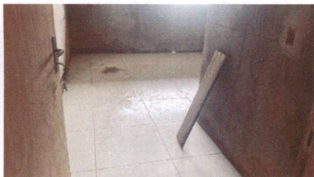
Foto 21: Aplicação de cerâmica na direção do Bloco A (Item 10.1.6)