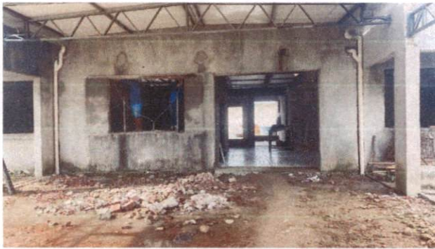
Foto 33: Tudo de PVC 100mm para drenagem de águas pluviais Lado interno AB (Item 13.1.1)