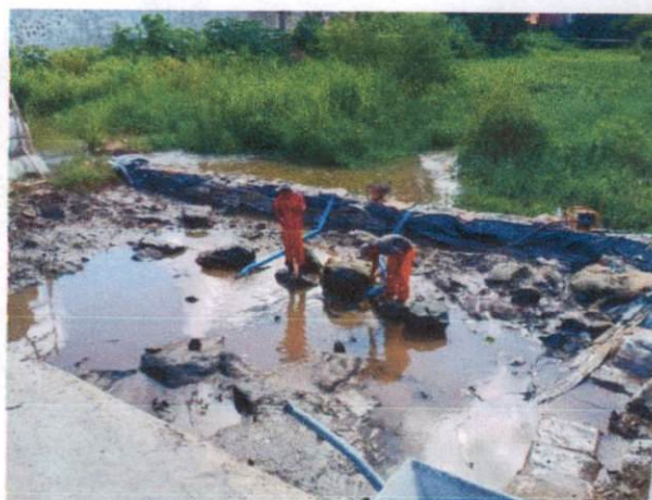
Descrição: ENSECADEIRA COM EMPREGO DE SACOS DE BARRO PARA ATERRO