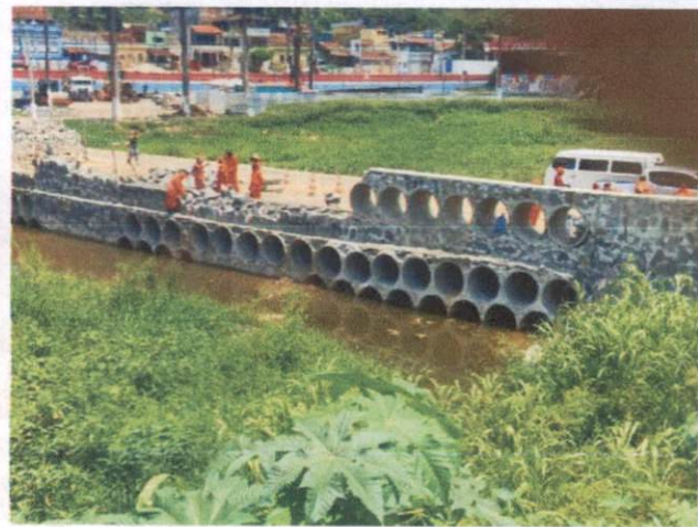
Descrição: TUBO DE CONCRETO PARA REDES COLETORAS DE ÁGUAS PLUVIAIS, DIÂMETRO DE 1000 MM, JUNTA RÍGIDA, INSTALADO EM LOCAL COM ALTO NÍVEL DE INTERFERÊNCIAS