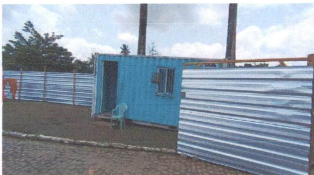
Descrição: TAPUME COM TELHA METÁLICA