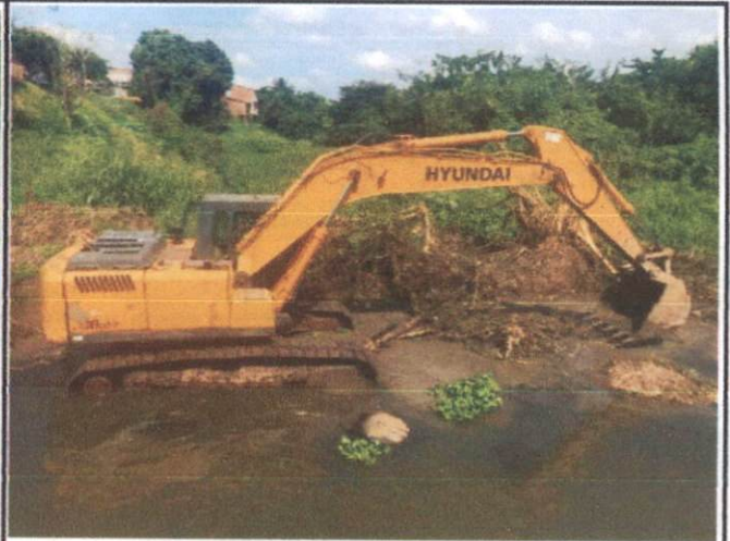
Descrição: LIMPEZA MECANIZADA DE CAMADA VEGETAL, VEGETAÇÃO E PEQUENAS ÁRVORES (DIÂMETRO DE TRONCO MENOR QUE 0,20 M)