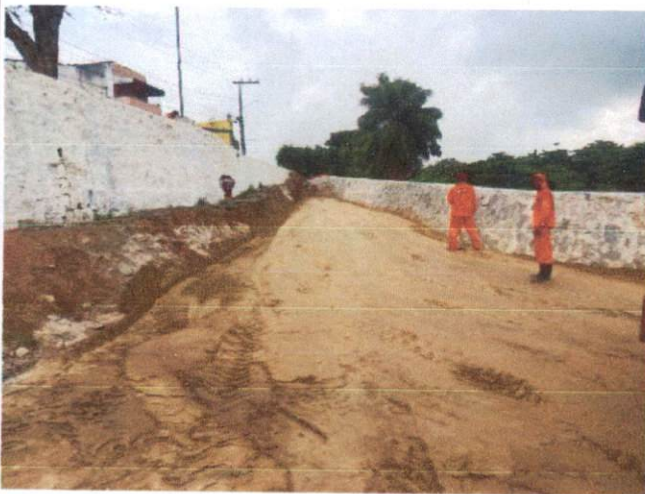
Descrição: EXECUÇÃO E COMPACTAÇÃO DE BASE E OU SUB-BASE PARA PAVIMENTAÇÃO DE SOLO (PREDOMINANTEMENTE ARENOSO) COM CIMENTO (TEOR DE 8%)