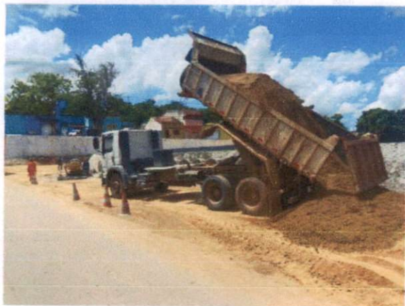
Descrição: CARGA E DESCARGA DE MATERIAL ATERRO INCLUSO MATERIAL ARGILOSO