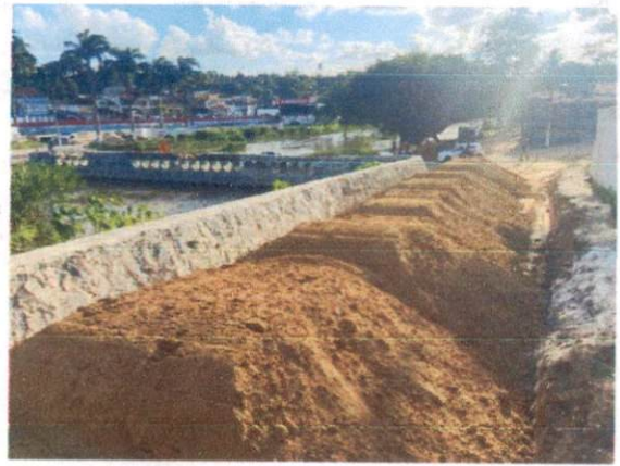
Descrição: EXECUÇÃO E COMPACTAÇÃO DE BASE E OU SUB-BASE PARA PAVIMENTAÇÃO DE SOLO (PREDOMINANTEMENTE ARENOSO) COM CIMENTO (TEOR DE 8%)