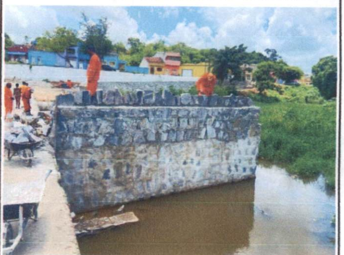
Descrição: MURO DE ARRIMO DE ALVENARIA DE PEDRA ARGAMASSADA