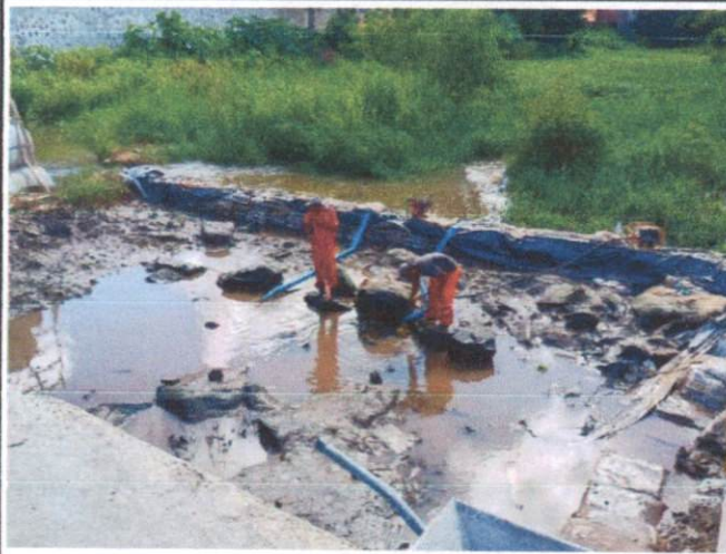
Descrição: ESGOTAMENTO DE VALA COM BOMBA SUBMERSÍVEL.