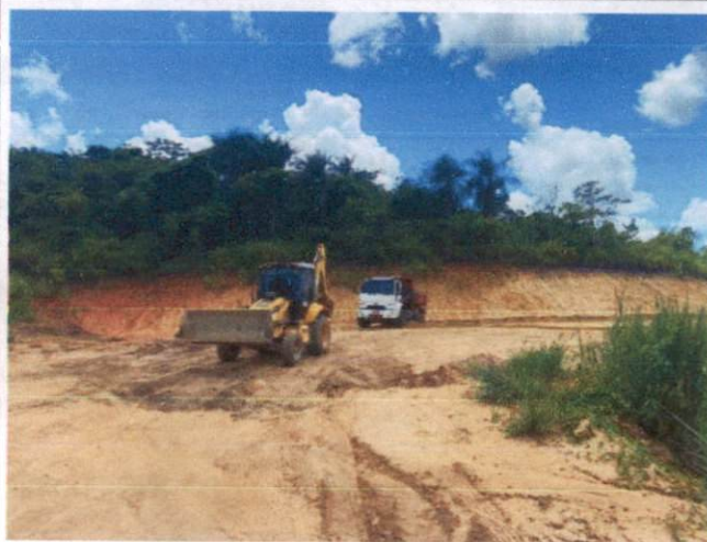
Descrição: CARGA E DESCARGA DE MATERIAL ATERRO INCLUSO MATERIAL ARGILOSO