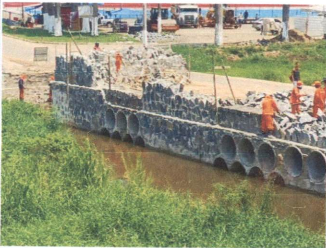
Descrição: MURO DE ARRIMO DE ALVENARIA DE PEDRA ARGAMASSADA