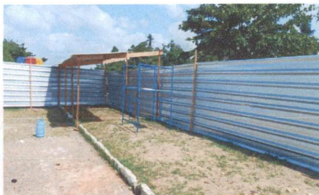
Descrição: TAPUME COM TELHA METÁLICA