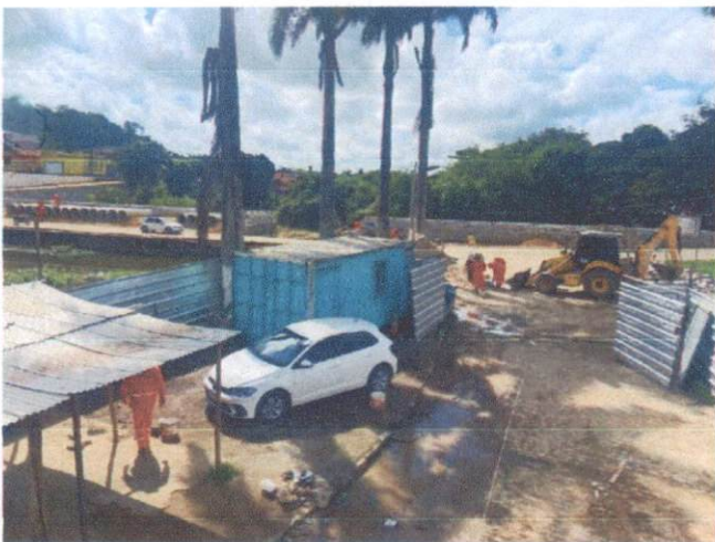
Descrição: LOCAÇÃO DE CONTAINER 2,30 X 6,00 M, ALT. 2,50 M, PARA ESCRITORIO, SEM DIVISÓRIAS INTERNAS ESEM, SANITARIO, (NÃO, INCLUI MOBILIZAÇÃO/DESMOBILIZAÇÃO) - (ALMOXARIFADO)