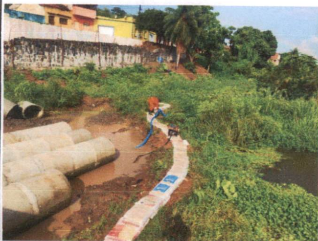
Descrição: ENSECADEIRA COM EMPREGO DE SACOS DE BARRO PARA ATERRO