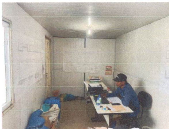
Descrição: LOCAÇÃO DE CONTAINER 2,30 X 6,00 M, ALT. 2,50 M, PARA ESCRITORIO, SEM DIVISÓRIAS INTERNAS ESEM, SANITARIO, (NÃO, INCLUI MOBILIZAÇÃO/DESMOBILIZAÇÃO) - (ALMOXARIFADO)